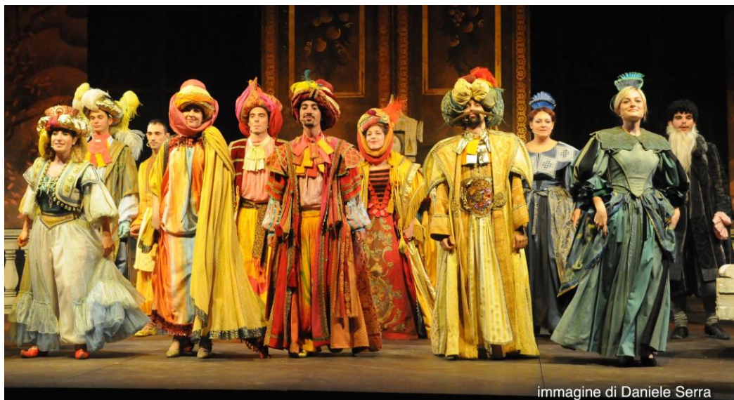
immagine di Daniele Serra

Esperto Discipline Coreutiche: prepara all'attività didattica della danza, attraverso le tecniche classica, contemporanea e jazz, nozioni basilari di cultura coreutica, elementi fondamentali di anatomia e studio critico.